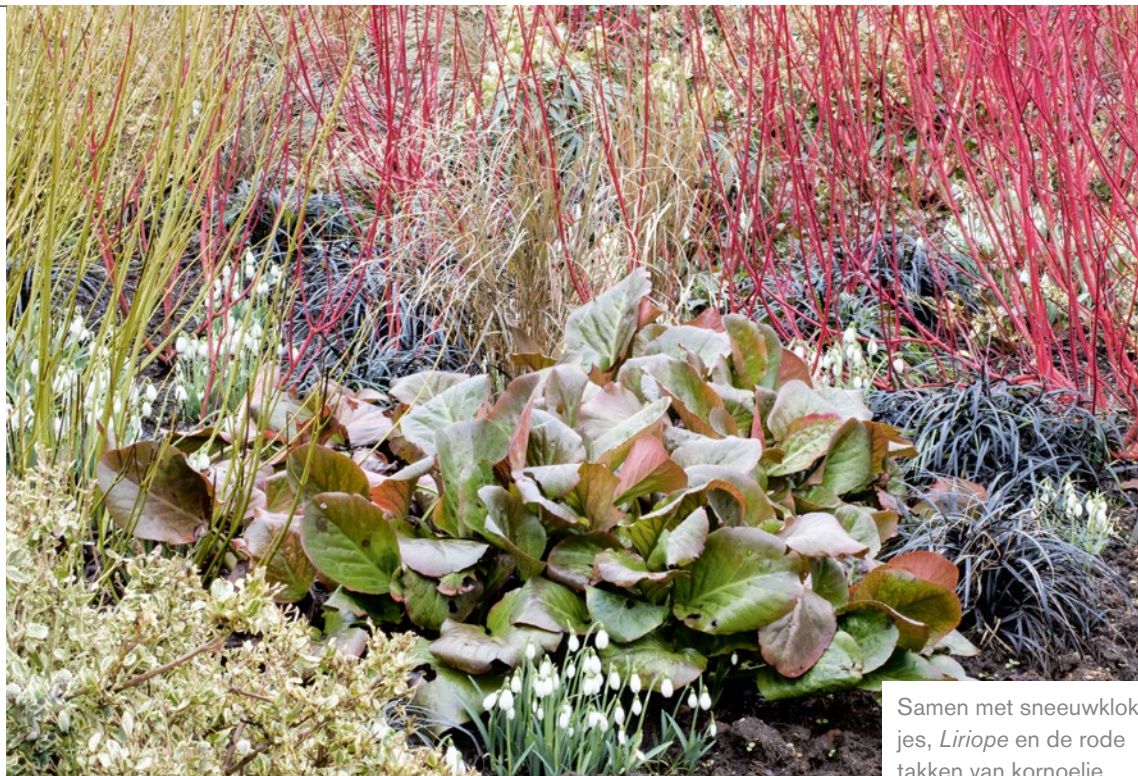
Samen met sneeuwklokies, Liriope en de rode takken van kornoelje.